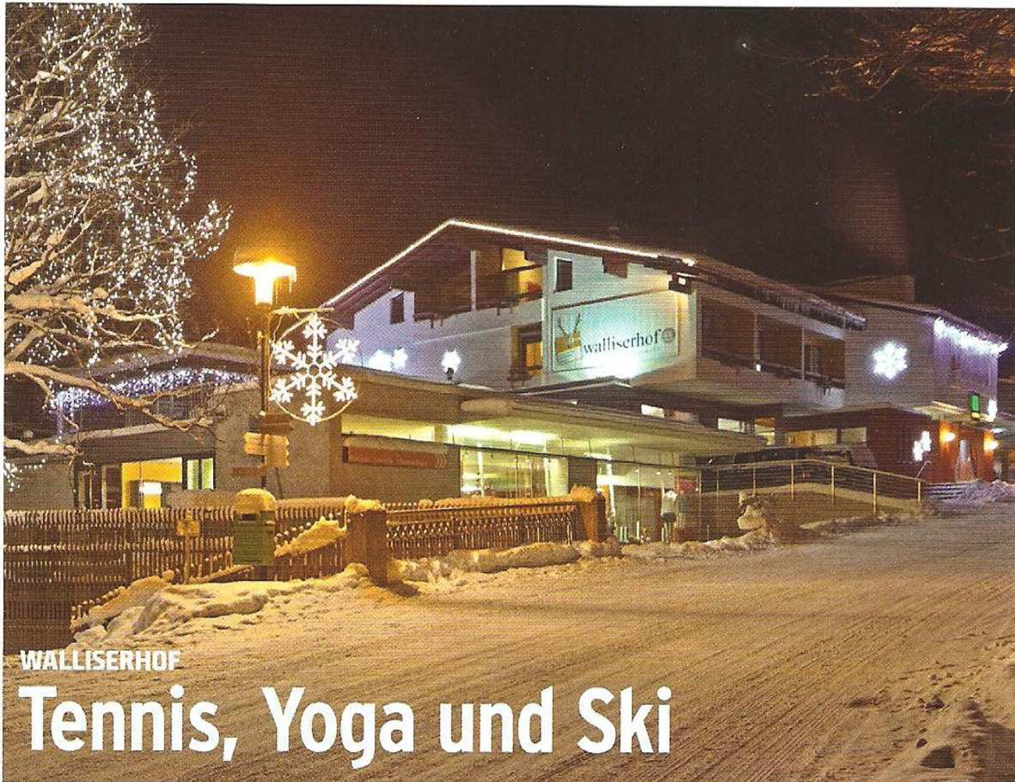
„Das familiäre Designhotel in den Alpen“ - so wirbt das Hotel Walliserhof (links) in Brand für sich.