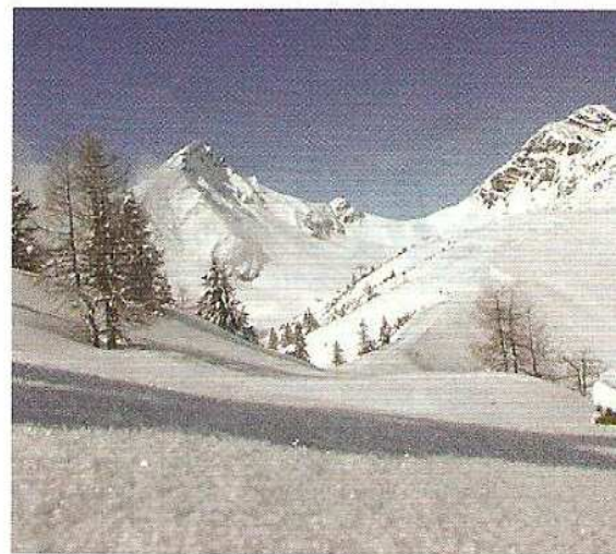
Im Winter warten in der Umgebung 55 Kilometer Skipisten, 14 Bahnen und Lifte und 30 Kilometer Loipen auf die Urlauber.