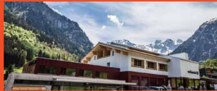
Hotel Walliserhof Vorarlberg

Mühdörflle 158, 6708 Brand, Österreich T: +43 (0)5559 221 | F: +43 (0)5559 445 E: scesaplana@s-hotels.com | W: www.scesaplana.at geöffnet von Januar bis Oktober