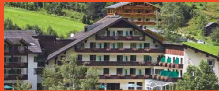
Hotel Scesaplana Vorarlberg

Mühdörflle 158, 6708 Brand, Österreich T: +43 (0)5559 221 | F: +43 (0)5559 445 E: scesaplana@s-hotels.com | W: www.scesaplana.at geöffnet von Januar bis Oktober