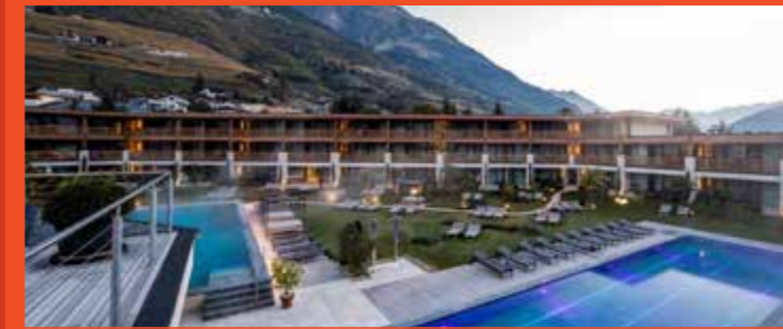
Hotel Prokulus Südtirol

Via Principale 19, 39025 Naturns, Italien T: +39 (0)473 667566 | F: +39 (0)473 66829 E: hotel@prokulus.it | W: www.prokulus.it geöffnet von April bis November