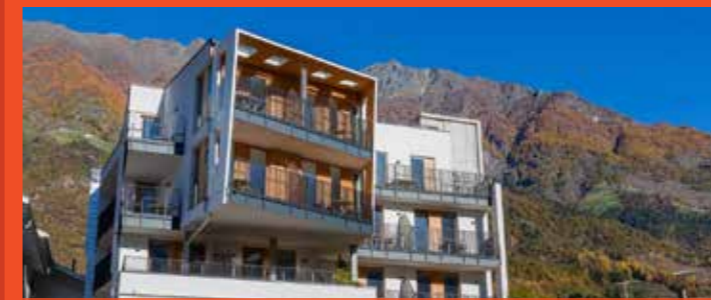
Hotel Kreuzwirt Südtirol

Via Principale 19, 39025 Naturns, Italien T: +39 (0)473 667566 | F: +39 (0)473 66829 E: hotel@prokulus.it | W: www.prokulus.it geöffnet von April bis November