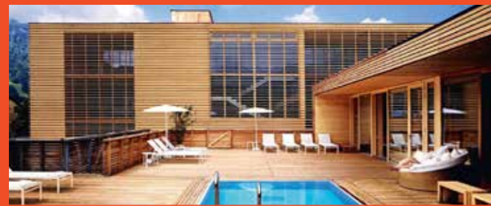
Hotel Post Bezau Vorarlberg

Gufer 43, 6708 Brand, Österreich T: +43 (0)5559 241 | F: +43 (0)5559 241 62 E: office@walliserhof.at | W: www.walliserhof.at geöffnet von Januar bis Dezember