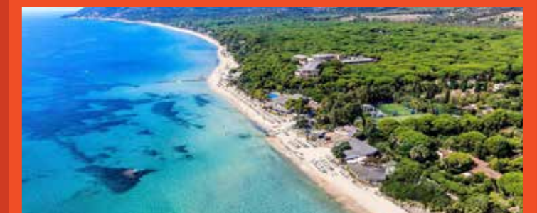
Forte Village Resort Sardinien

Hauptstraße 47, 39025 Naturns, Italien T: +39 (0)473 667 110 | F: +39 (0)473 668 252 E: info@kreuzwirt.net | W: www.kreuzwirt.net geöffnet von Januar bis Dezember